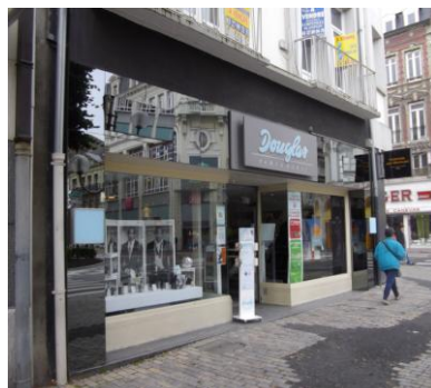
Parfumerie « DOUGLAS » – Place d'Armes à DOUAIS (59)