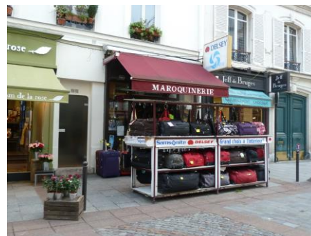
Maroquinerie S. Samad – rue Cler à PARIS (7 ème )