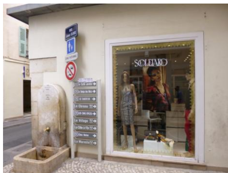
Boutique « SOULEIADO » – 34 rue James Close à ANTIBES (06)