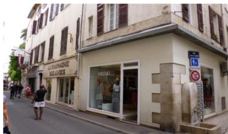
34 rue James Close - ANTIBES (06)